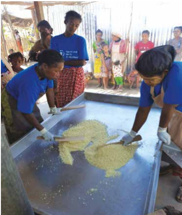
Quelques femmes bénéficiaires du projet

Améliorer, dans trois régions du Grand Sud malgache (Anosy, Androy et Atsimo Atsinanana), le profil de consommation des ménages, en particulier la sécurité alimentaire et le statut nutritionnel des femmes et des enfants à travers l'accès à des produits alimentaires de base fortifiés, tout au long de l'année.