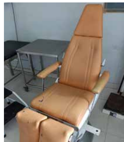
Le fauteuil de chambre pour malade octroyé à l'hôpital

Pour tous les services confondus : 1 échographe, 1 incubateur de mise en culture, 1 caisson de bureau, 2 fauteuils roulants, 1 fauteuil de chambre pour malades, 1 chariot de soins, 1 cloison pour radio, 1 imprimante radio RX, 1 table pneumologique, 8 cartons de protections adultes, 8 lots de gel, 1 packaging de laryngoscope à usage unique, 4 atèles, 2 écharpes contre écharpes, 2 paires de béquilles, 6 ensembles de champs stériles, 4 cartons de perfuseurs, 1 panoplie de pipettes labo, 2 cartons de coton labo, 1 ensemble de jeux pour pédiatrie, 1 lot de Amios, 4 glucomètres avec coton, 1 lot de sur blouses, 2 boîtes de déboucheurs, 1 boîte à pansement vide, 1 carton de set de pose, 1 carton de drain, et 1 lot de protection jambe.