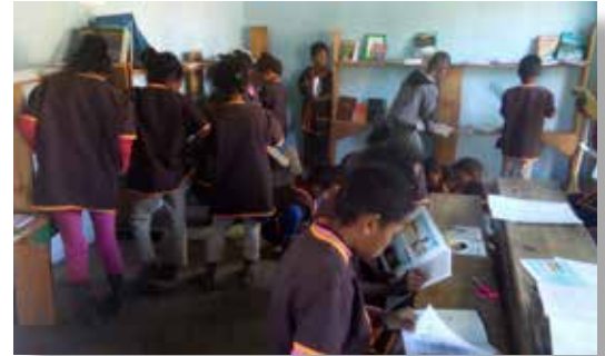
Les enfants se ruent à la nouvelle bibliothèque