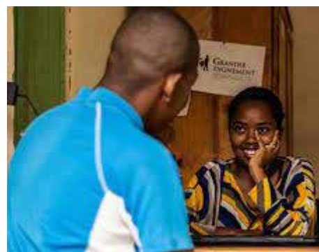
L'Assistance en milieu carcéral

L'appui du Consulat a permis de consolider ce service et favoriser sa pérennité, par un soutien en termes de ressources humaines et d'activités.