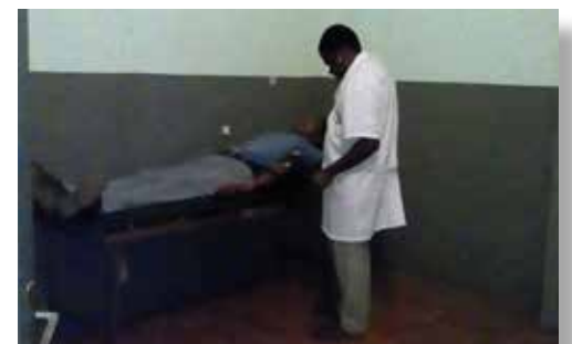
Un médecin consulte un patient sur la table d'examen

Pour tous les services confondus : 1 fauteuil malade, 1 chaise trouée, 1 chariot de soins, 1 pied potence, 2 plateaux de soins, 1 détendeur oxygène, 1 table d'examen, 4 haricots médicaux, 1 siège accompagnateur, 2 cartons de produits nettoyants, 1 tableau, 1 carton de tubes de laboratoire, 2 cartons de kits artériels, 2 cartons de gants d'examen, 1 aérosol thérapie, 2 paquets de solutions hydro-alcooliques, 2 cartons de consommables ORL, 1 lot de consommables dentaires, 1 carton de gel, 3 boîtes de masques d'anesthésie, 2 cartons de coton et des kits de masques chirurgicaux.