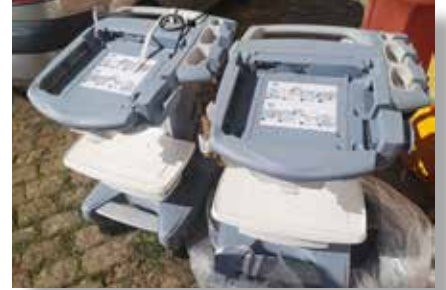
Réception des deux chariots pour échographe

L'association « ASA » ou « Ankohonana Sahirana Arenina », prenant en charge des familles en grande précarité a été équipée de deux chariots pour échographe, indispensables pour les centres de santé de base sous sa tutelle. Créée en 1991, elle a pour vocation d'accueillir et de réinsérer les familles sans-abri exclues ou en voie de marginalisation, afin de les aider et les accompagner à recouvrer dignité autonomie en créant les conditions propices à cette autonomisation progressive.