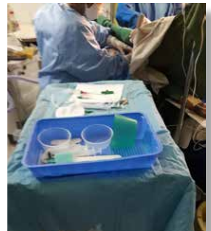
Quelques consommables médicaux reçus

Pour tous les services confondus: 1 Source lumière froide pour endoscopie, 2 cartons de glucomètre, 1 pédale échographe, 1 fauteuil dentaire mobile avec têtère et aspirateur à salive, 1 lot de lames laryngoscopie, 1 compresseur d'air, 1 dosimètre, 1 instrument CRYO, 1 carton de gel, 3 lots de masques, 1 support radio, 1 radio dentaire, 1 développeur radio, 1 générateur radio avec table pupitre, 2 lits gonflables, 1 audiométrie avec table ORL, 1 tensiomètre, 1 cuve radiologique, 1 bouteille d'oxygène, 4 lots de masques, 2 cartons de jeux pédiatriques, 2 cartons de seringues angiographie, 4 cartons de nettoyeurs pour matériels AMIOS, 1 youpala pour pédiatrie, 1 balance pèse-bébé, 4 pneus de fauteuil roulant, 1 tabouret, 1 sac plastique de jouets pour enfants, 1 paquet de seringues de gavage, 1 paquet de couches adulte, 1 ensemble de tenues pour filles de salle, 1 câble pour extracteur oxygène, 1 landau pour pédiatrie et 1 chaise pour kangourou pédiatrique.