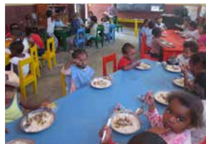
La cantine du midi

L'objectif de ce projet cantine consiste à contribuer à l'accès aux droits les plus élémentaires des enfants : droit à l'éducation, la santé et la nutrition. C'est dans cette perspective qu'il s'est approvisionné en denrées alimentaires pour la cantine scolaire, pendant quatre mois (riz, viande, huile, pois secs)