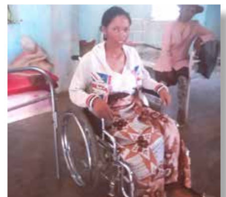
Le CSB équipé d'un nouveau fauteuil roulant

Pour tous les services confondus : 1 échographe, 1 lampe mobile sur pied, 1 fauteuil dentaire, 1 compresseur dentaire, 1 fauteuil roulant, 1 carton superfuseur, 1 carton robinet à 3 voies, 1 carton cathéter chirurgical et 2 cartons Vygon valve life.