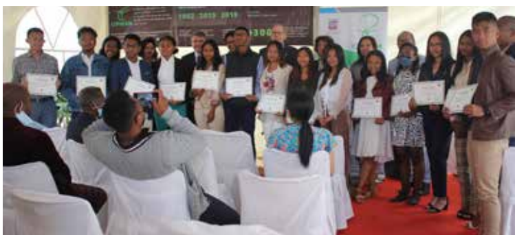
Nos 18 boursiers de la 3ème promotion licenciés officiellement

Au titre de l'année universitaire 2021-2022, le programme compte 66 boursiers. Cette diminution par rapport aux autres années s'explique par la sortie de la première promotion de bénéficiaires ayant tous décroché leur Master 2 avec plusieurs étudiants partis à l'étranger pour poursuivre leurs études. En effet, 7 parmi eux ont obtenu leur Master 2 et plusieurs sont partis poursuivre leurs études à l'étranger dans des destinations comme La Réunion via « la Bourse d'Excellence Hozizon », France et Allemagne en passant par le programme « Au pair ».