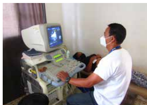
L'échographe en utilisation

Pour tous les services confondus : 1 inhalateur pour enfant, 1 table d'accouchement, 1 échographe, 3 lits électriques, 3 matelas, 1 stérilisateur, 3 cartons de couches pour adulte à la maternité ainsi qu'1 bouteille d'oxygène portable.