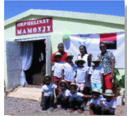
Les responsables de l'ONG Mamonjy avec les enfants de l'orphelinat