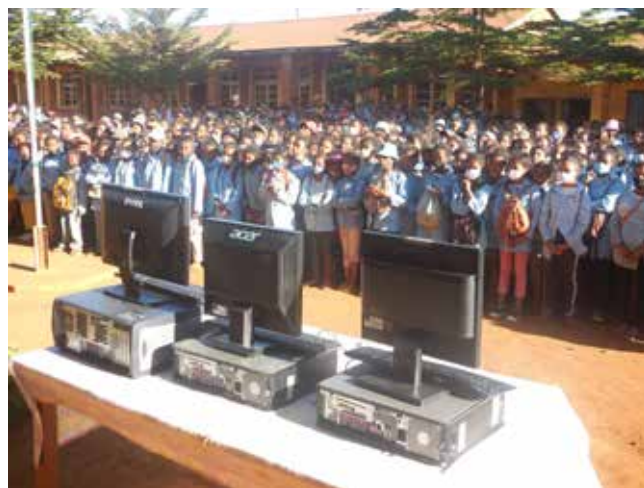
Lors de la remise officielle des matériels informatiques à Antsirabe