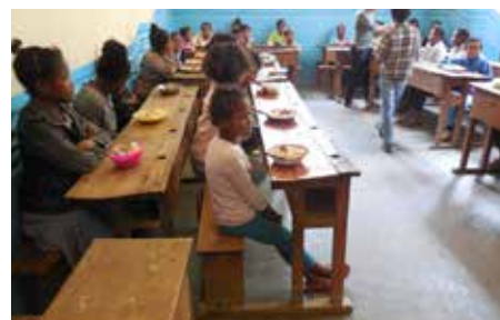
La cantine scolaire

Le Consulat s'est penché également sur la question alimentaire des enfants car il a été constaté que plusieurs enfants ne sont pas assidus en cours ni concentrés, voire abandonnent l'école en raison de sauts de repas et de faim. Dans le but d'augmenter le taux de fréquentation à l'école, cette initiative a donc été mise en œuvre depuis l'année scolaire 2014-2015.