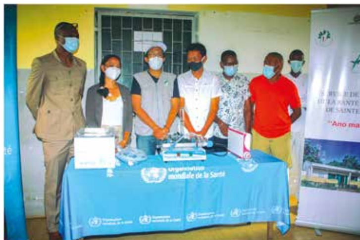
Visite officielle de SEM Ministre de la Santé Publique, le Représentant Pays par intérim de l'OMS et Madame la Coordinatrice Pays de la Coopération monégasque