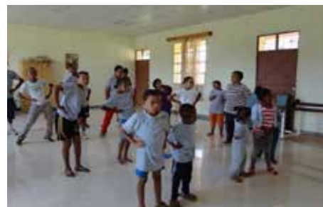
L'activité sportive, incluse dans les programmes spéciaux pour les enfants handicapés

La maison a pu récolter de nouveaux médicaments pour assurer la pérennité des services médicaux au cours de l'année 2021.