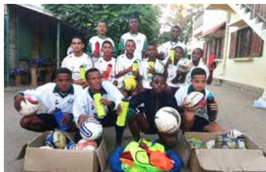
Jeunes bénéficiaires des kits sportifs

Il est à noter que depuis ses 14 années d'existence, cette école a collaboré avec le Consulat depuis 2006. Ces équipements serviront à 197 élèves pour cette année scolaire 2020-2021 dont la majorité est issue de familles nécessiteuses.