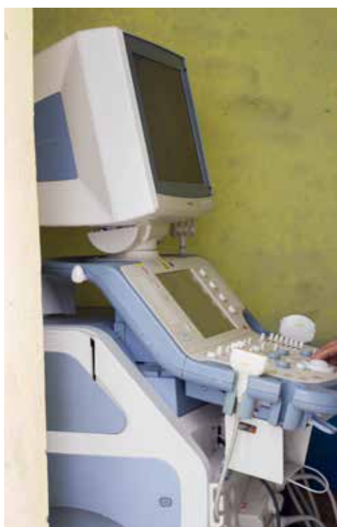
L'échographe doté par le Consulat

Pour tous les services confondus : 1 échographe, 1 armoire métallique, 1 caisson de bureau, 1 fauteuil roulant, 8 cartons de protection adulte, 2 cartons de matériels de nettoyage, 8 cartons de gel hydro alcoolique, 1 boîte de speculum, des kits d'intubation pédiatriques, 1 déambulateur, 1 carton de bocks de lavement, 1 écharpe contre écharpe, 3 atèles, 1 lot de masques faciaux d'anesthésie pour enfants, des kits de sondes, 5 prothèses vasculaires, 3 boîtes de cathéters vasculaires, 5 lots de champs, 1 carton de ballons de dilatation périphérique, 1 carton d'aiguilles hubert, 1 kit de pansements à voie centrale, 1 lot de filtres à air bactérien, 9 cathéters de dialyse, 1 ensemble de champs opératoires, 1 panoplie de tubes de prélèvement, 1 carton de coton labo, 1 carton de système d'inflation, 1 boîte d'instruments gynécologiques, 4 sets d'instruments chirurgicaux, 3 ensembles d'instruments de chirurgie cervicale et 1 carton d'aspirateurs électriques.