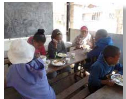
Un moment de partage lors du repas à la cantine

Cette association intervient dans la lutte contre la malnutrition, pour la scolarisation et l'accès aux soins médicaux. Dans le cadre de son programme de prise en charge du couple mère-enfant, cette dernière a mis à disposition des enfants une cantine scolaire. Afin d'améliorer et de diversifier la qualité du repas chaque midi, l'association a pris l'initiative de compléter le repas des enfants en leur offrant des desserts à raison de trois par semaine soit du yaourt tous les lundis et mercredis et des fruits les vendredis. Ce projet a pu bénéficier à 120 enfants issus de 50 familles.