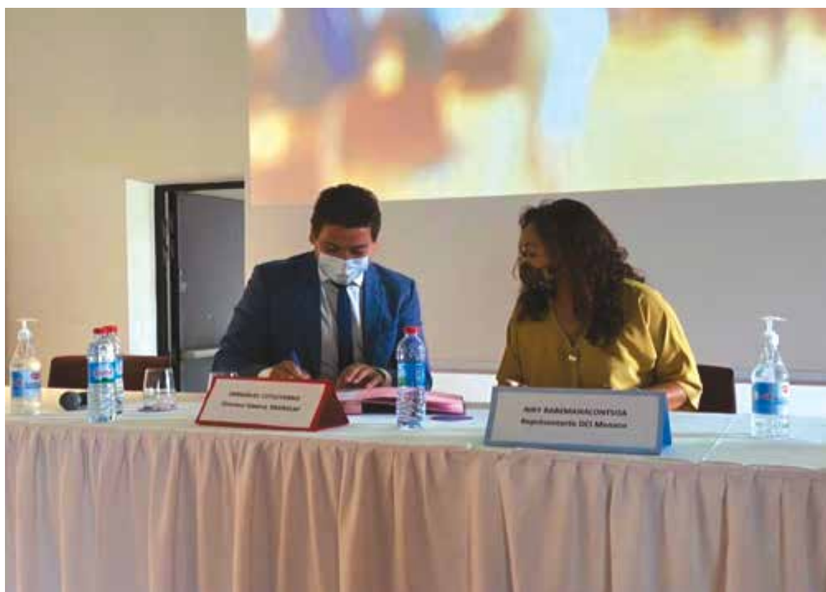
Lors de la signature de convention.