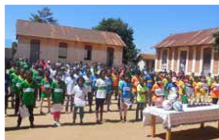
Quelques photos prises lors de la remise des équipements à Antananarivo, à Ampefy et à Antsirabe