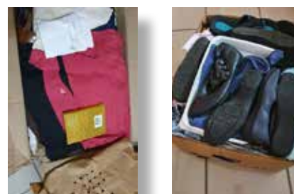
Les quelques équipements reçus

Existant depuis près d'une trentaine d'années, l'Association des Sœurs du Christ fournit aux 400 jeunes démunis qu'elle accueille et prend en charge, une éducation, des soins médicaux ainsi que des formations professionnelles. Pour cette année 2021, il lui a été remis des lots de couverts, fournitures scolaires, draps, livres et accessoires divers, sans compter les consommables médicaux et les effets personnels à usage des sœurs missionnaires en provenance d'Europe.