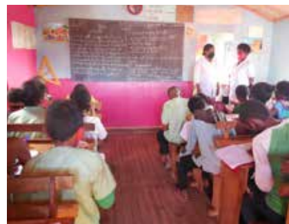
Une des classes parrainées