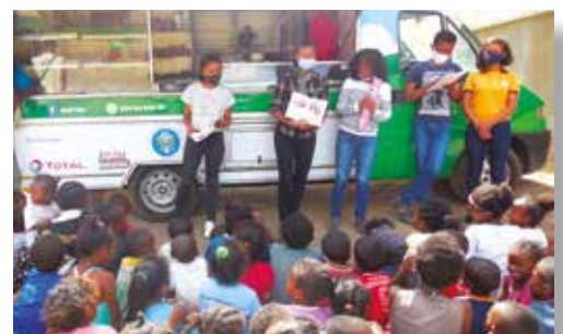
Le bibliobus attire l'attention des enfants

Des matériels scolaires tels que des ouvrages et manuels ont été ainsi acquis en 2021, et le financement a également pu assurer le paiement de la prestation des animateurs.