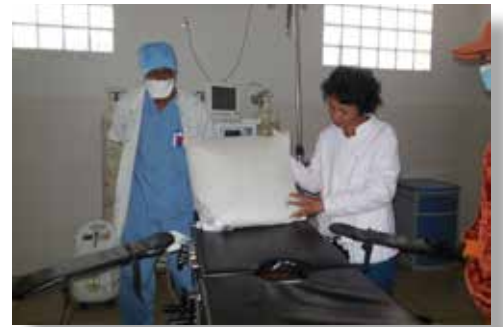
La table d'examen installée dans le bloc opératoire

Pour tous les services confondus: 1 table d'examen, 4 matelas avec housse, 2 chaises roulantes, 1 toise pour bébé, 2 cannes, 1 paire de béquilles, 1 déambulateur, 2 cartons de masques d'anesthésie, 2 cartons de kits de ponction lombaire, 2 lots de kit péridural, 1 lot de trousse d'extrémité, 1 paquet de couches adultes, 3 lots de kits pour bloc plexique, 2 paquets de couches enfant, 5 ensembles de poche à lavement, 1 coussin à éponge et 1 boîte à pansements.