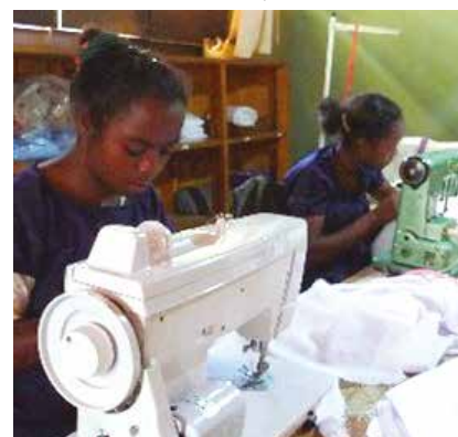
L'accès aux ateliers des femmes, avec les nouvelles machines à coudre