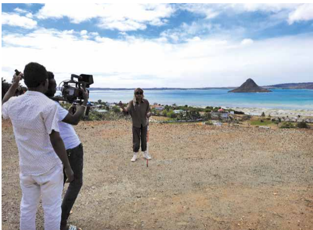
Le tournage pour un film documentaire-reportage