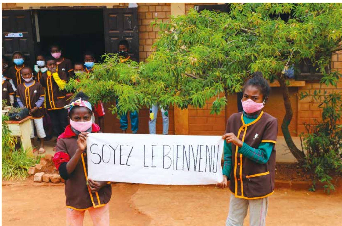
L'accueil chaleureuse des enfants à l'EPP de Manandriana