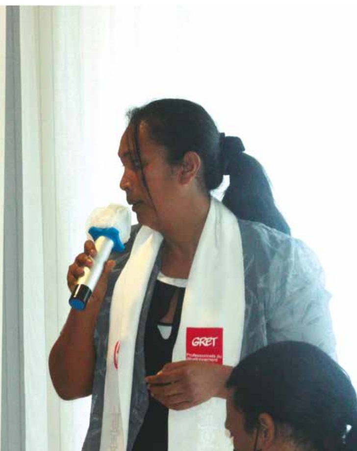
Lors de l'atelier de clôture en novembre