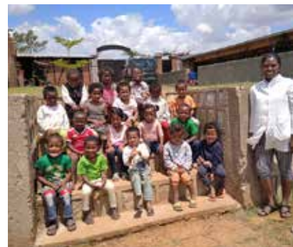
Intégration d'enfants dans le milieu scolaire

En 2021, l'association a mis en place une aire de jeux extérieurs pour 50 enfants de 4 à 5 ans afin d'améliorer la capacité psychomotrice des enfants en préscolaire au sein du Village Manorina.