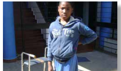
Un patient avec le déambulateur doté

Pour tous les services confondus: 1 table de pansement, 3 matelas, 3 lits, 1 bouteille d'oxygène, 2 paires de béquilles, 1 potence sans pieds, 1 déambulateur, 1 chaise de repos pour malade, 1 poussette pour pédiatrie, 1 tabouret, 7 cartons de masques, 5 lots de gel hydro alcoolique et 2 palettes de désinfectants pour matériels médicaux.