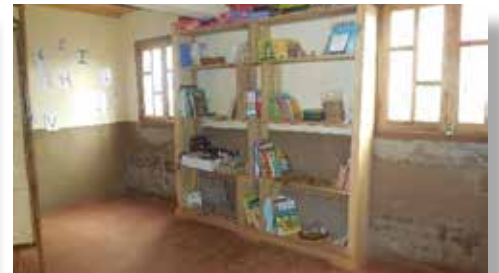
Les réalisations en 2021