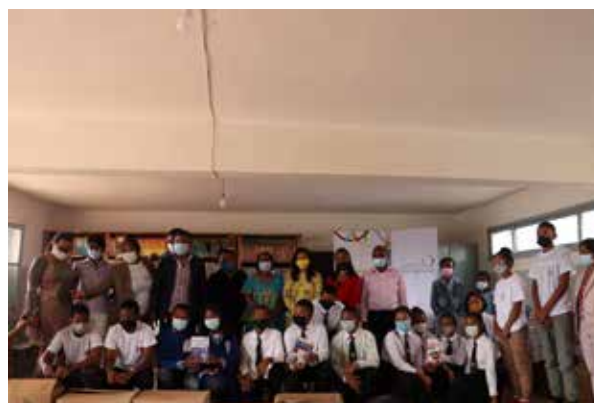
Un retour en images de la remise de livres se déroulant au CEG Ambohimandra