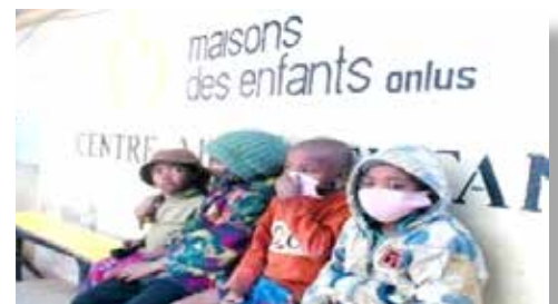
Les enfants en attente d'être servis à la cantine

Par ailleurs, la maison a instauré la «Maison de famille» pour offrir une maison aux enfants âgés entre 0 et 6 ans abandonnés par leur famille afin de pouvoir grandir dans une ambiance familiale avec la certitude d'un avenir serein.