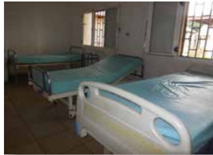
Les lits et matelas installés dans la chambre de l'hôpital

Pour tous les services confondus : 1 fauteuil roulant, 1 perche à perfusion, 4 lits électroniques, 4 matelas, 1 armoire basse à tiroirs, 1 cloison pour radio, 1 porte brancard sur roulettes, 1 déambulateur, 8 cartons de protection adulte, 6 cartons de gel hydro alcoolique et 2 cartons de jeux pour le service pédiatrie.