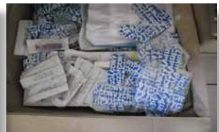
Les divers consommables médicaux