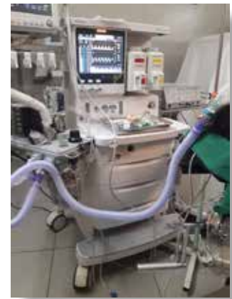
Utilisation d'un circuit pour respirateur en bloc opératoire

Dans le cadre de la lutte contre le Covid-19 : 2 cartons de Combi Flex pour le système respiratoire, des kits de protection amplificateurs de brillance, des lots de visières, des blouses et pantalons de médecin, des cartons de kits pour pose de voie centrale, des circuits patients pour respirateurs ainsi que des circuits de JACKSON REES.