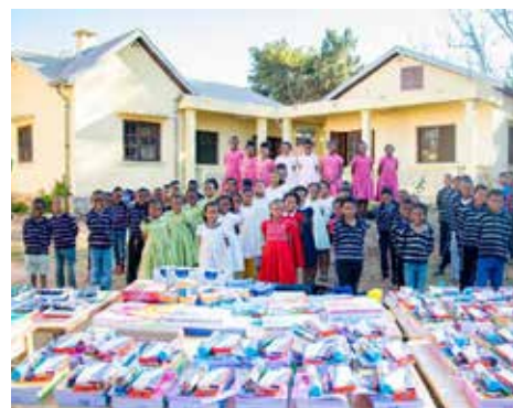
Les écoliers recevant de nouveaux kits scolaires

Le financement de 2021 a permis l'achat de fournitures scolaires et de matériels pédagogiques.