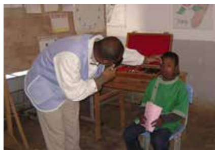
Une consultation pour une éventuelle paire de lunettes

Cette année, elle a obtenu de la part du Consulat 4 cartons de lunettes usagées.