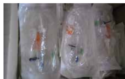
Quelques consommables médicaux reçus