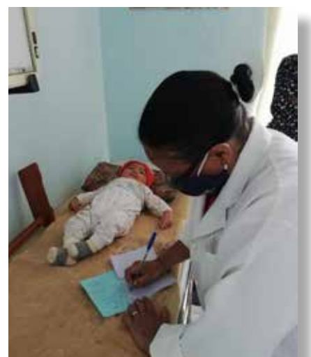
La table d'examen servit pour une visite systématique au dispensaire

Par ailleurs, sa mission prioritaire est aussi de répondre aux demandes et aux besoins sanitaires de la communauté d'Ambohitrimanjaka, là où il est implanté. Au titre de cette année, il lui a été donné : 11 cartons de compresses non tissées, 1 échographe, 1 appareil ECG avec impression, 1 table d'examen, 1 toise adulte, 2 toises enfants, 1 fauteuil roulant, 1 pèse bébé, 1 négatoscope et 50 cartons solutions hydro alcoolique.