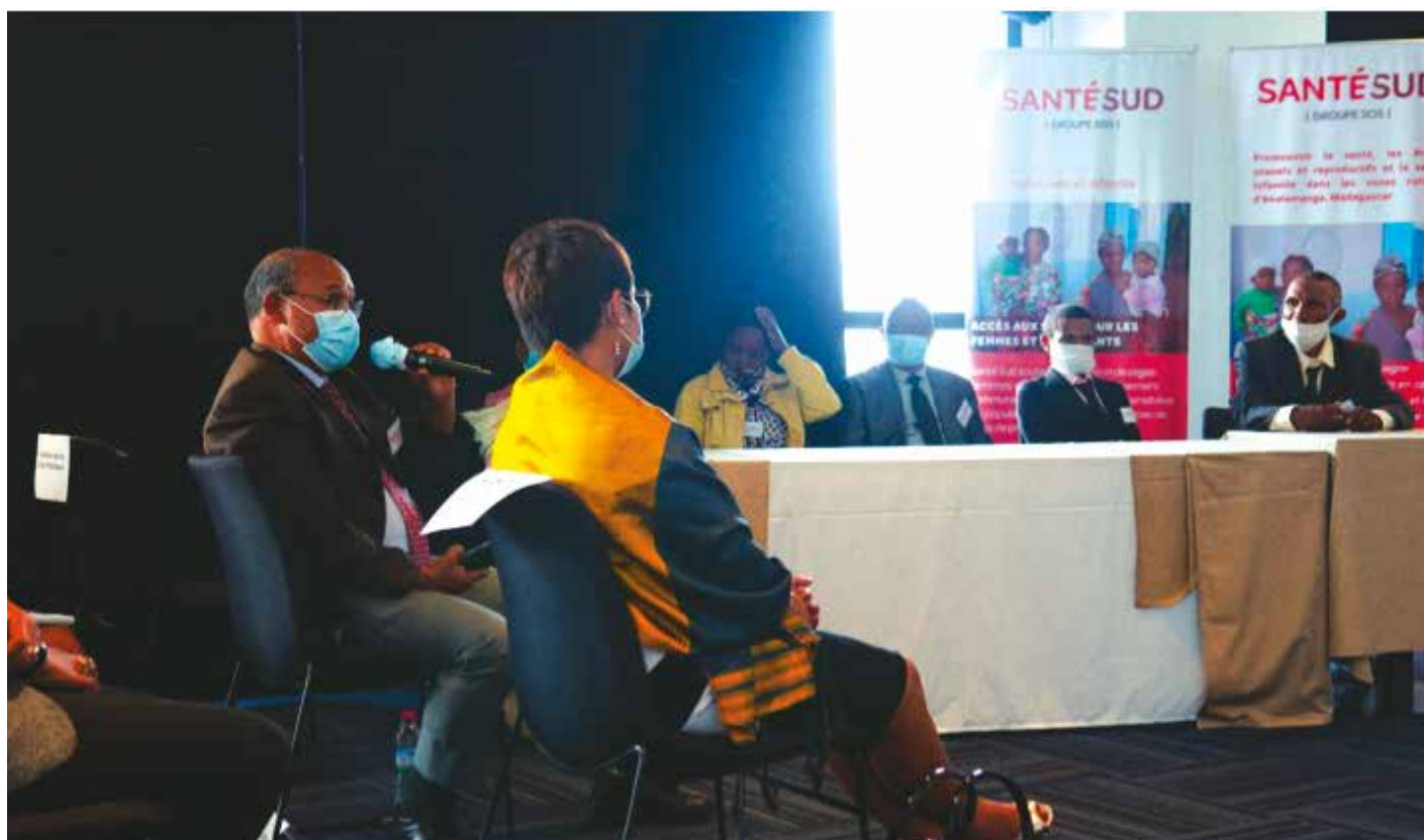
Atelier de capitalisation