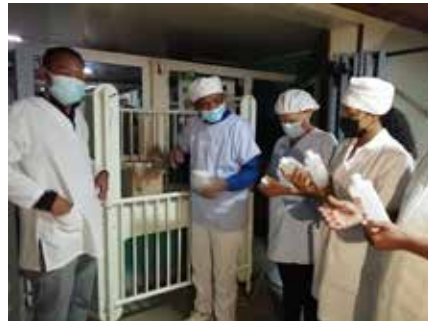
Les gels nettoyants

Destiné à tous services de l'hôpital : Perfuseur pour adulte, Sur blouse, glucomètre, Pipette labo, coton, Set de pose, Amios nettoyant matériels médicaux, Seringue angiographie, Speculum, Set de masque et calot, Surfuseur.