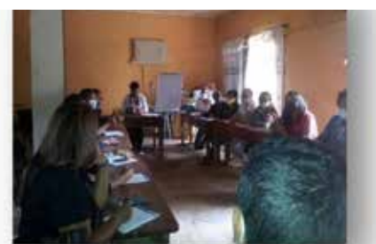
Séance de formation des volontaires

L'Association a également réalisé des journées de répit au niveau de ses antennes dans les 6 provinces. Ces actions ont été réalisées sur une durée de 6 mois.