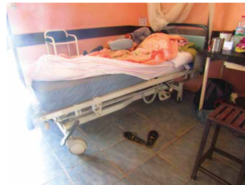
Lit d'un malade dans un CSBII du district d'Ifanadiana.

L'ONG a pour objectif de faciliter l'accès à des soins adéquats pour la population de Fianarantsoa. Elle oriente des familles à adopter une mode de vie plus saine. Le Consulat a tenu à affirmer son soutien dans cette mission en mettant à leurs dispositions: 4 lits d'hôpital, 3 matelas, 1 armoire métallique, 2 cartons de poche à urine, 1 déambulateur et 2 cartons de masques en tissu pour mieux les équiper et améliorer la qualité des prises en charge des malades au sein d'un CSBII dans le district d'Ifanadiana.