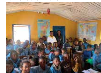
Les élèves de la classe ASAMA lors de la visite du Consulat de Monaco

Financer les frais de déplacement lors des activités de reboisement avec les enfants.