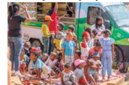
Bibliobus de l'Association Ank'Izy

Depuis 2017, l'Association Ank'Izy ou « Ankin'ny ho avy izy » oeuvre pour contribuer d'une part, au développement personnel des enfants scolarisés dans les Ecoles Primaires Publiques (EPP) et offrir d'autre part, à des enfants vulnérables l'opportunité d'avoir accès à l'éducation.