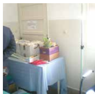
Dons de cartons de kits de perfusion et cartons de gels désinfectants pour le CHU Joseph Raseta Befelatanana

Une seconde remise a été réalisée en août 2022 comprenant : 06 cartons de poches à urine, 02 cartons de gels désinfectant, des Amios décontamination, nettoyage surface, 03 cartons de seringue 50CC, 02 cartons de prolongateur pousse seringue, 02 cartons de kits perfusion, 05 boîtes de sondes nasogastriques, 01 boîte de sets de pansement, 05 cartons de cathéter central, 04 boîtes d'aiguilles APL 20g, 02 cartons de masques en tissus, 02 cartons de désinfectants matériels, 02 cartons de kit de ponction artérielle, 02 boîtes de masques pour ballons, 02 cartons de perfuseurs, 02 boîtes d'embouts à catheter, 04 boîtes de kits de ponction, 02 cartons de perfuseur simple voie.