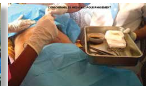
Consommables médicaux pour pansements