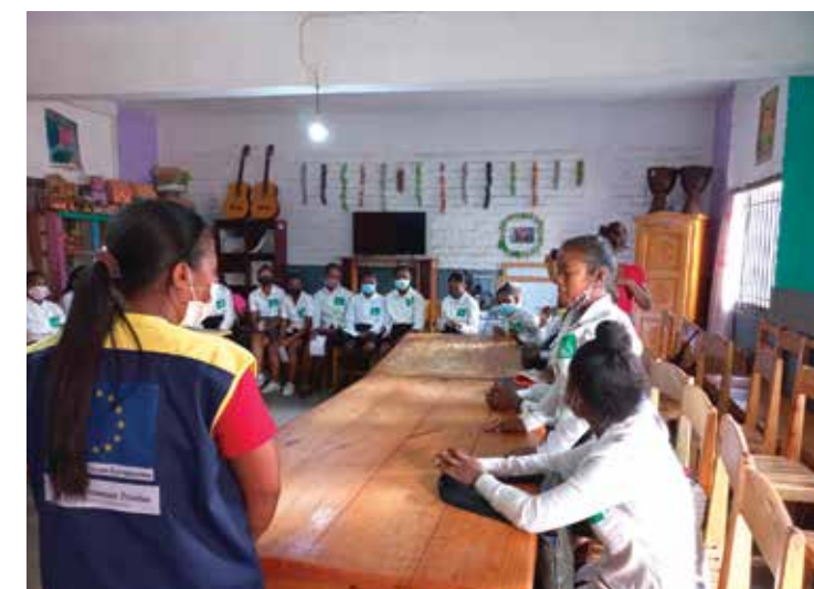
photo durant une sensibilisation en matière de Santé et Droit Sexuel Reproductive (SDSR) avec Médecins du Monde

Elaboration d'un guide pour les défenseurs des droits des femmes et contribution à la révision du Plan d'Action national budgétisé en Planification familiale et élaboration du Manuel de formation en SDSR pour les enseignants du secondaire.