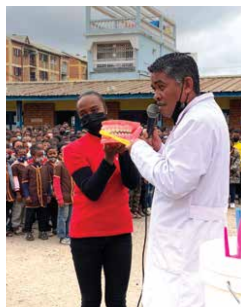
Séance de formation et de sensibilisation sur l'hygiène bucco-dentaire avec Colgate