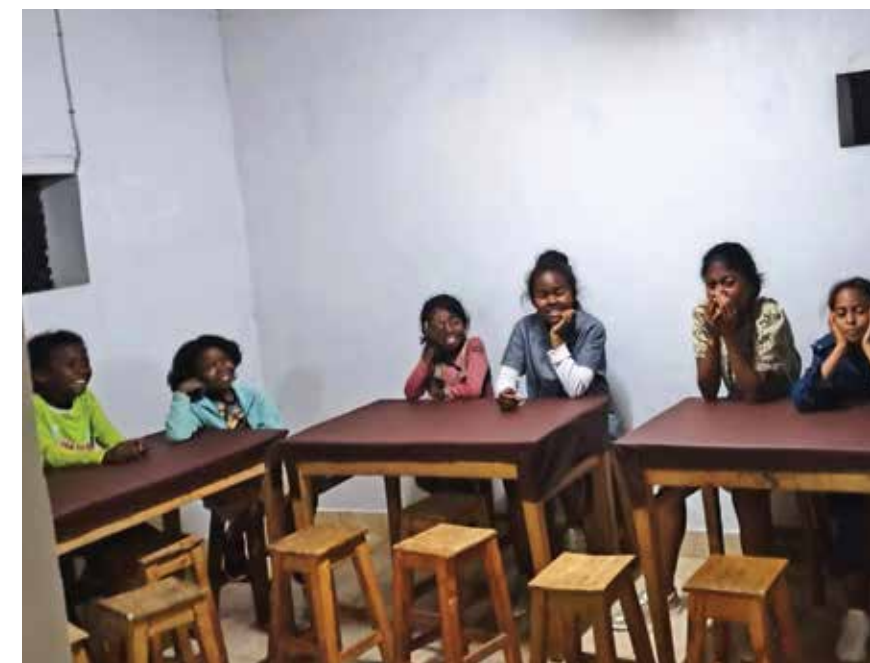
Les élèves dans le réfectoire renové et réaménagé