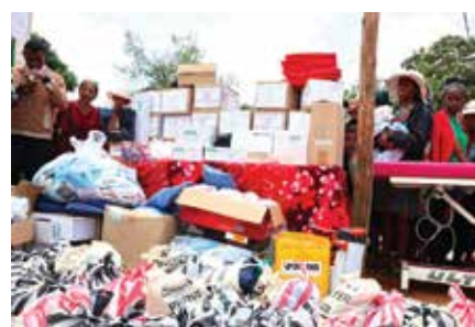
Arrivée des cartons contenant les instruments médicaux à bonne destination.

L'ONG TAMANA a pour objectif de susciter et participer à des projets humanitaires tout en développant un accompagnement global. Elle a sollicité l'appui du Consulat pour équiper le CSBII d'Ambohimaha en matériel médical et a ainsi reçu : 2 boîtes de cathéter artériel, 1 boîte de paille de prélèvement, 1 boîte de sonde de nutrition antérale, 1 boîte de seringue 10ml, 1 boîte de seringue 5ml, 6 trousse de kit de champs, 13 sets périduraux, 6 cartons de gels, 2 sets procédure, 3 kits de serviettes, 14 seringues 60ml, 5 seringues de 20ml, 100 seringues de 1ml, 1 carton de biovalves, 1 carton de tubulure pompe à perfusion, 1 boîte de poche recueil d'urine, 3 boîtes de Spike B Valve, 1 boîte de masque d'anesthésie pour adulte, 2 cartons de masque d'anesthésie pour enfant, 1 paquet de couche adulte, 2 cartons de dispositif de perfusion, 1 paquet d'étiquettes, 1 boîte de nutrition, 1 boîte de sonde d'aspiration, 1 boîte de cathéter ombilical, 1 carton de poche à lavement, 3 kits chirurgicaux, 1 carton de masques en tissu, 1 table d'examen.