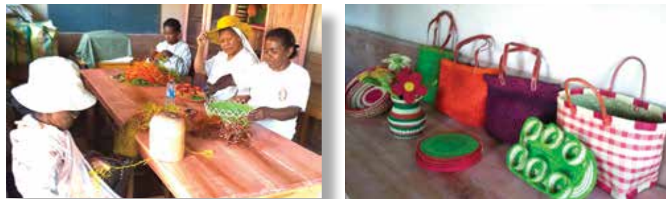
Atelier de créations à l'Association Soa Mahefa

Dans ce sens, l'activité de l'association se porte vers l'artisanat. Elle vise à aider les personnes en situation de handicap à leurs auto-développements sociaux et économiques. L'appui du Consulat a ainsi permis à l'association d'assurer la continuité de cette activité à travers l'achat de mobiliers et d'équipements. Cette collaboration contribue à l'amélioration de l'organisation du travail au centre, et assure la performance et l'augmentation de la production des activités génératrices de revenus.