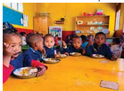
Un déjeuner à la cantine scolaire avec l'Association Internationale de Charité et les enfants bénéficiaires

La collaboration entre le Consulat et l'Association rentre dans le domaine de l'éducation et de la nutrition. En effet, le Consulat contribue à l'approvisionnement de la cantine scolaire au profit de 130 enfants âgés de 3 à 12 ans. L'objectif de ce projet cantine consiste à contribuer à l'accès aux droits les plus élémentaires des enfants : droit à l'éducation, la santé et la nutrition. C'est dans cette perspective qu'il s'est approvisionné en denrées alimentaires pour la cantine scolaire, pendant trois mois (riz, viande, huile, pois secs).