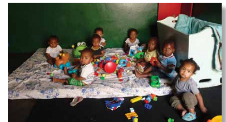
Enfants incarcérés avec leurs mères à Antanimora