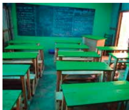
La salle de classe ASAMA

Afin de soutenir cette initiative, le Consulat a appuyé l'association pour acquérir des tables-banc et un tableau mural.