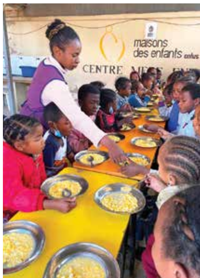
Pause goûter façon Malagasy avec les enfants

Cette année, le Consulat de Monaco a choisi d'appuyer le Centre Mère Enfant. Il se charge concrètement de l'hébergement, de la nourriture, de la prise en charge médicale, de la scolarisation, des loisirs ainsi que de la régularisation des papiers administratifs des enfants qui sont en leurs charges (acte de naissance). L'appui a consisté à l'achat de médicaments pour approvisionner le dispensaire du centre et de riz pour la cantine au profit de 253 mères et 482 enfants.