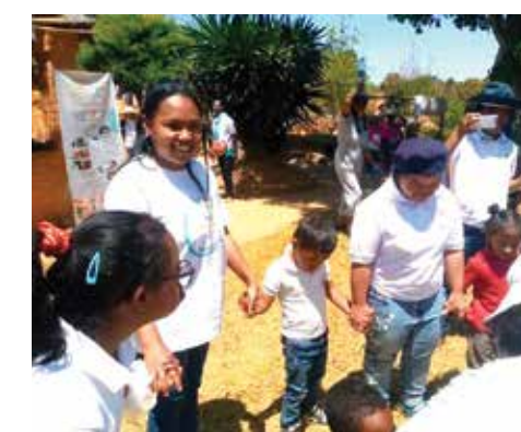
Journée récréative avec les enfants, le 1 er Octobre 2022