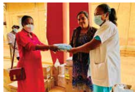
Journée de la remise des dons au centre avec notre Coordinatrice des Appuis

Pour tous les services confondus, le centre hospitalier a reçu : 02 cartons de masque d'anesthésie, 01 carton de VYSET bloc plexique, 1 carton kit de soin, 02 cartons de poche à urine, 01 carton kit bilumière, 01 boîte de seringue 1CC, 01 chaise trouée, 01 carton de rampe robinet 3 voies, du désinfectant pour matériaux médicaux, 02 cartons de gels hydro alcooliques, 02 cartons de masques en tissu, 01 paquet de seringue de gavage, 05 seringue 10 CC, 05 seringue 25 CC, 01 déambulateur.