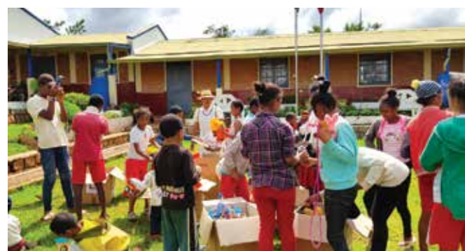
Les enfants découvrant leurs nouveaux jouets.

Cette année, l'association a obtenu de la part du Consulat : 01 ordinateur complet, 02 claviers et accessoires, 2 cartons bras articulés, 2 cartons bocaux, 1 carton gel hydro alcooliques, 1 carton de jouets, 75 unités de seringues 1 cc, 75 unités de seringues 5 cc.