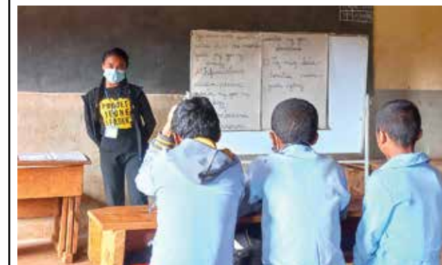
Séance de sensibilisation au niveau des collèges d'enseignement général.

Contribuer à l'épanouissement individuel et collectif de filles et garçons vulnérables conduisant à l'émergence de nouvelles pratiques éducatives, sociales, sanitaires et environnementales dans un contexte d'extrême pauvreté à Madagascar.