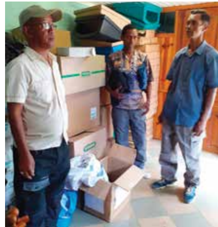
Les cartons à distribuer pour les différents services, CHRD Manjakandriana

On leur a doté de : 1 fauteuil repos malade, 4 cartons poches à urine, 2 cartons masques en tissu, 1 appareil musculaire, 5 cartons de champs opératoire, 2 cartons de désinfectant surface, 3 cartons désinfectants matériels médicales, 7 cartons gels hydro alcooliques, 3 cartons et 4 boîtes de sonde d'aspiration, 4 cartons sondes naso-gastriques, 3 pots, 2 cartons masques d'anesthésie taille 1, 3 cartons ANYOS désinfectants, 4 filtres antibactériens, 1 carton Diovalve, 1 carton seringue 2.5CC, 2 cartons seringue de gavage, 1 couverture, 7 coussins, 22 couches adultes, 1 carton de kit épisiotomie, 1 carton de kit écoplest, 2 cartons de seringue 60 CC, 2 cartons de Kit plexus, 1 carton de masque d'anesthésie taille 3, 1 carton et 1 boîte de cathéter jaune, 1 raccord anesthésie, 1 pose pied pour fauteuil roulant, des pièces pour fabriquer des potences (en adaptation), des potences, 1 Déambulateur, des matériel de Kiné, 1 boîte de compresse.