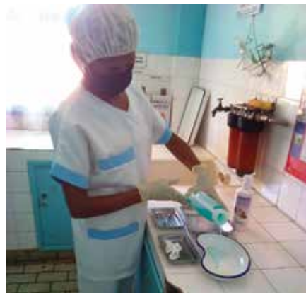
Une infirmière en train de stériliser des instruments médicaux

Afin de contribuer à la normalisation des équipements en matériels de l'hôpital, pour une meilleure prise en charge des patients, le Consulat de Monaco a remis gracieusement à tous les services de l'hôpital : 02 chaises trouées, 03 cartons de lunette COVID, 01 marteau réflexe, 02 pinces chirurgicales, 02 paires de ciseaux chirurgicales, 01 haricot, 02 toises bébé, 01 tableau de lecture ophtalmologique, 03 plateaux de pansement, 01 déambulateur, 03 cartons de jeux pour pédiatrie, 05 cartons de solutions hydro alcooliques, 10 flacons de savons antiseptique, 01 cartons d'Anios désinfectant de matériels médicaux, 04 cartons de masques en tissu, 01 boîte de seringue 50cc, 15 boîtes de seringue 5cc, 1 boîte de seringue 10cc, 08 cartons de poches à urine, 07 boîtes de sonde naso-gastrique, 21 boîtes d'aiguilles à ponction lombaire, 02 boîtes de perfuseurs, 02 cartons de pansement.