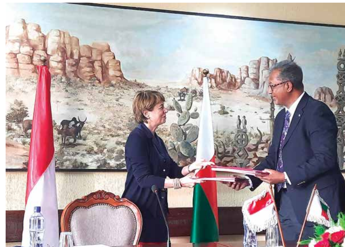
Renouvellement de la Coopération entre Monaco et Madagascar à travers la signature d'un accord -cadre avec le Ministère des Affaires Etrangères