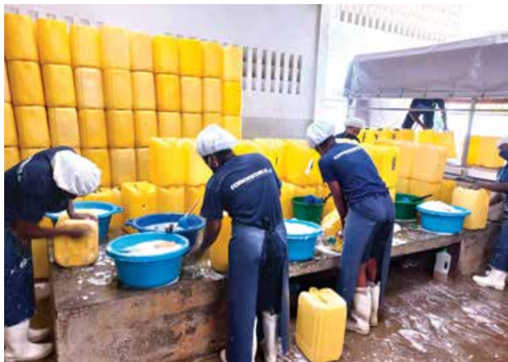
1 001 FONTAINES