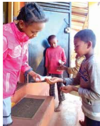
Un moyen sûr pour prévenir le Covid-19 : utiliser fréquemment du gel désinfectant

Aidée par le Consulat depuis 2016, cette année, le Dispensaire de l'ONG Zazakely Sambatra a été doté de nettoyeurs surface, d'Anios désinfectant, d'Anios Surf, de cartons d'hydro gel, de cartons de savon doux, des cartons de masques textiles pour prévenir les risques liés au COVID-19.