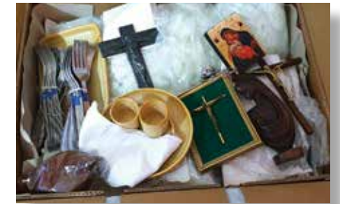
Parmis les colis reçus

L'Association Soeurs du Christ aide 400 jeunes démunis à travers des prises en charge de l'éducation, des soins médicaux et des formations professionnelles. Pour les appuyer dans cette action, le Consulat leur a remis 18 cartons de matériels et de divers accessoires contenant également des consommables médicaux et des effets personnels à usage des sœurs missionnaires en provenance d'Europe.