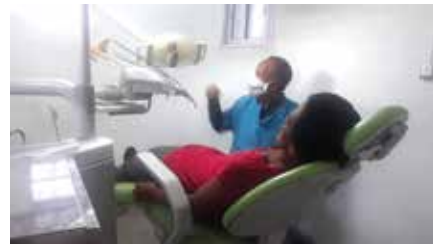
Un siège dentaire au dispensaire Menalaingo.

Dans le but d'appuyer le dispensaire pour promouvoir le droit à la santé à travers un système cohérent, renforcé et équitable, le Consulat a donné 02 cartons de chapeaux de pailles, 01 fauteuil dentaire, 01 siège dentiste, 01 compresseur d'air, 01 meuble de cabinet dentaire, 01 carton de gants chirurgicaux, 05 cartons de masques textiles, 05 cartons de désinfectant, 05 cartons de détergeant de surface, 02 protecteur cutané, 01 carton de feneste, 01 carton de rame dentaire, 28 cartons de gels hydro alcooliques, 10 cartons de savon doux.