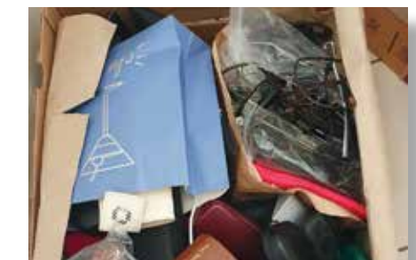
Chaussures et divers effets remis par le Consulat à la congrégation des sœurs filles de la sagesse.

Cette année, elle a obtenu de notre part 02 cartons et 01 males de différentes fournitures, d'autres équipements nécessaires aux religieuses et à l'organisation dans la mise en œuvre de leurs activités.