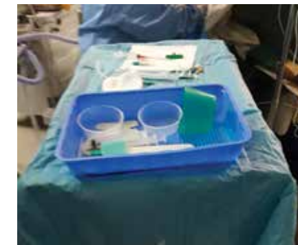
Des instruments médicaux en vue d'une opération.

Le centre hospitalier Anosiala a reçu : 01 armoire métallique, 06 bouches d'aspiration, 90 flacons en verre, 27 flacons pour goutte, 11 visières, 1 carton de flacon de redon, 2 cartons de savons lavantes, 02 cartons de désinfectants nettoyants pour surface, 04 cartons de gels hydro alcooliques, 02 cartons de désinfectants matériels, 02 cartons de masques en tissu, 01 carton de flacons, 02 cartons de désinfectants lave-sol, 02 boîtes de seringues 60cc, 01 carton de kit de voie veineuse centrale, 01 carton de seringue de gavage, 04 cartons de champs stériles, 01 carton de poche Stomie, 01 carton de masque pédiatrie, 02 boîtes de filtres anti-bactériens, 01 carton de pompe gonflage sonde, 01 carton de perfuseur sonde nasogastrique, 01 boîte de ballonnet vasculaire, 03 boîtes de sondes d'aspirations, 05 boîtes de sondes nasogastriques pour pédiatrie, 01 carton de kit de pansement, 03 boîtes de sondes nasogastriques, 01 boîte de voie veineuse central, 01 carton de cathéter, 02 cartons de désinfectants, 01 carton de jeux pédiatrique, 02 boîtes de superfuseur, 04 cartons de poches à urine.