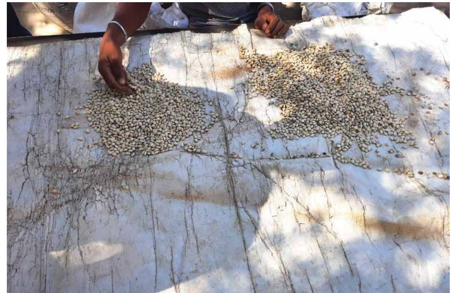
Les graines en cours de séchage

Visite des blocs d'Ebana qui a été durement impacté par la sécheresse de 2020 et 2021 et qui fera l'objet de redynamisation pendant la phase du projet.