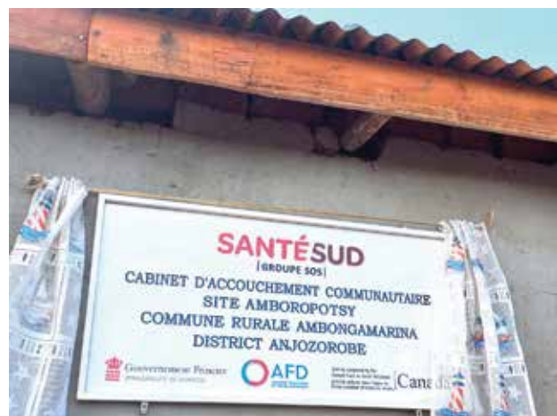
Enseigne d'un nouveau site d'accouchement communautaire