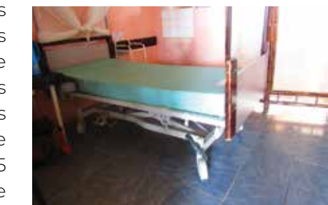
Un nouveau lit pour les malades.

Les sœurs St Paul de Chartres travaillent depuis des années dans le domaine de l'éducation et de la santé. Afin de les soutenir dans la mise en œuvre de leurs actions dans le domaine de la santé, le Consulat leur a remis 05 lits, 05 matelas, 15 chaises, 02 tables de bureau, 02 armoires, 01 poubelle, 01 escabeau.