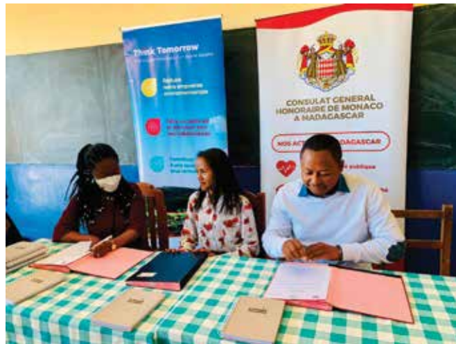
Signature de la convention tripartite entre le Consulat de Monaco, la Société VITOGAZ et l'EPP Faravohitra Ambony