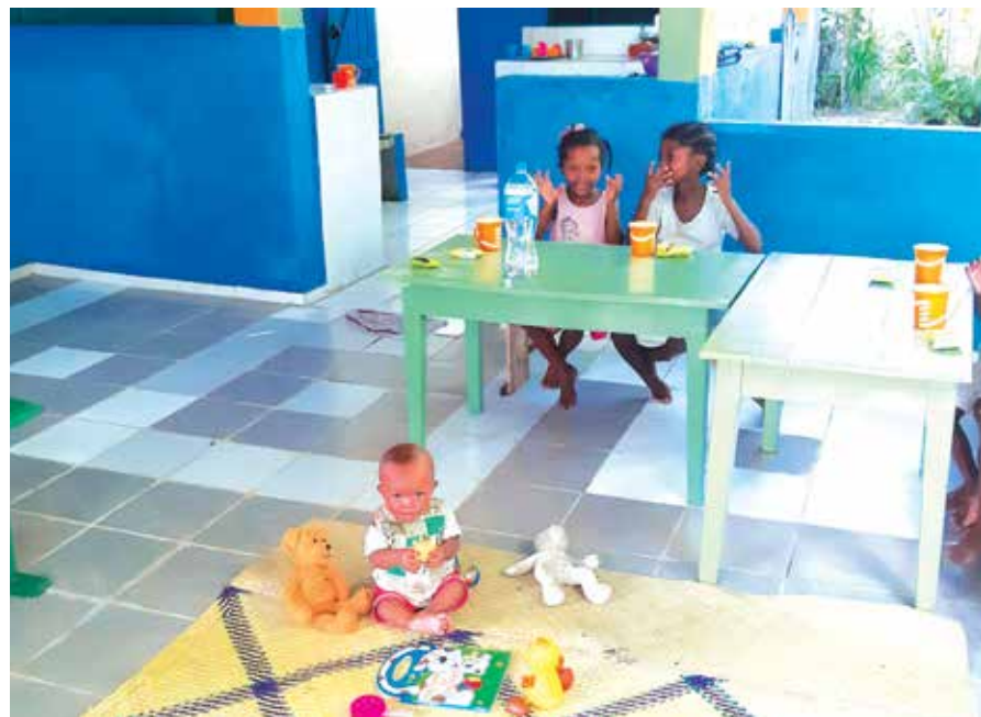
La cuisine réhabilitée du centre