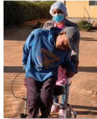
Un malade essayant son tout nouveau déambulateur

Le centre a reçu : 06 plateaux de pansement en plastique, 01 plateau de pansement en aluminium, 03 boîtes de sondes naso-gastrique pour bébé, 01 béquille standard, 01 chaise trouée, 01 chaise d'équipement, 01 déambulateur, 01 carton de speculum en plastique, 01 ambu à bébé, 01 fauteuil repos malade, 01 matériel de kiné, 06 champs opératoire, 05 lampes à pétrole.