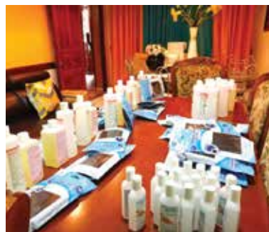
Dons de cartons de masques, de gels et de savons pour prévenir la propagation du COVID-19

L'ADSAA est une association œuvrant pour le développement social des familles du quartier d'Ampefiloha Ambodirano tout en proposant des tarifs communautaires pour les consultations médicales. Afin de l'appuyer dans les prises en charge gratuites qu'elle offre aux familles en grande précarité, le Consulat lui a remis : 04 cartons de masque UNS, 13 cartons d'Aniosurf ND Premium, 04 cartons d'Aniosafe savon doux, 06 cartons de Surfa'Safe, 01 carton d'Hexanios G+R, 12 cartons Aniosgel.