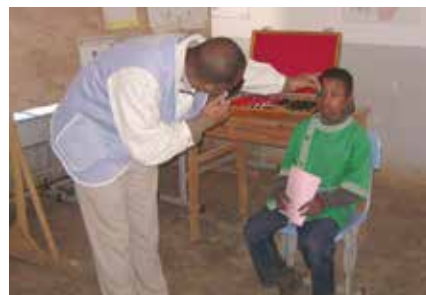
Ophthalmologue de l'association en consultation

Cette année, elle a obtenu de la part du Consulat 02 cartons de lunettes usagées.