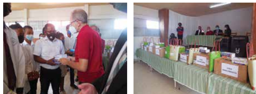
Retour en image sur la remise des livres durant la semaine de la Francophonie.