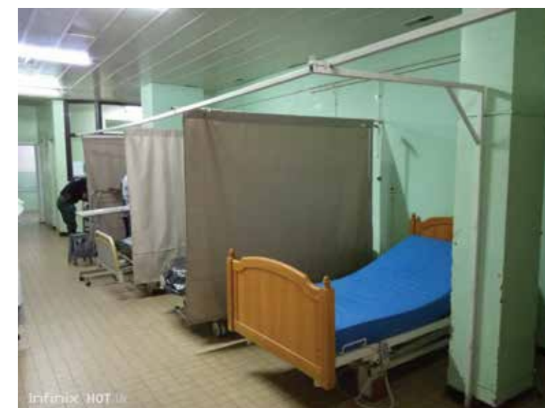
Un des lits électriques offerts au CHU Joseph Ravoahangy Andrianavalona

Pour une meilleure prise en charge des patients, le Consulat Général Honoraire de Monaco a remis gracieusement à tous les services du CHU Joseph Ravoahangy Andrianavalona : 02 chaises roulantes, 02 déambulateurs, 05 lits électriques, 05 matelas, 03 chaises blanches, 02 chaises bleues, 01 armoire, 01 congélateur, 01 stéthoscope, 02 chaises trouées, 02 fauteuils de repos malade, 03 amios nettoyage matériels, 07 boîtes de sonde à urine, 1 boîte de prothèse cheville, 04 boîtes de bas de contention, 01 boîte de poche colostomie, 02 boîtes de protège vasculaire, 05 boîtes de chambre implantable, 07 cartons de poche à urine, 08 cartons de gel hydro alcoolique, 01 carton de savon doux, 03 cartons de savon antiseptique chirurgicale, 02 chariot poubelle, 04 boîte à outils, 01 stabilisateur.