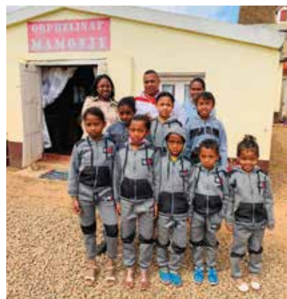
Photo avec les enfants de l'ONG