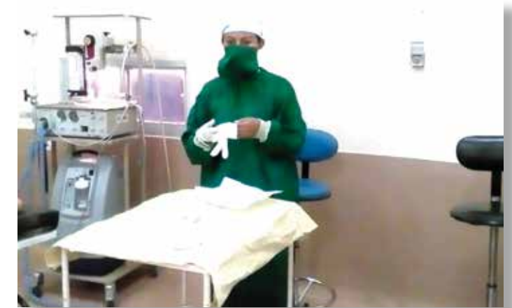
Médecin allant sortir du bloc opératoire.

Le centre hospitalier a reçu : 05 lits médicalisés avec matelas, 01 armoire, 03 déambulateurs, 01 comptoir d'accueil, 01 fauteuil roulant non pliable, 01 chaise trouée, 03 chaises blanches, 04 cartons d'ANIOS Gels nettoyants pour matériels médicaux, 04 cartons de poches à urines, 20 gels hydro alcooliques, 03 cartons masques textiles, 12 Anios lavage des mains pour bloc opératoire, 03 cartons de solution hydro alcooliques, 03 cartons de sets perfuseurs, 02 cartons de seringues de gavage de 50ml, 03 cartons de lunettes de protection pour COVID, 02 cartons d'aiguilles PM, 02 boîtes de dossier suspendu, 03 cartons de drain, 02 cartons de seringue 60cc, 01 carton de seringue 20cc, 02 cartons de champs, 01 carton de sonde de gavage, 01 carton de masque anesthésie, 01 carton d'aiguille rose de ponction lombaire, 01 boîte de compresse à gaze, 01 boîte de perfuseur.