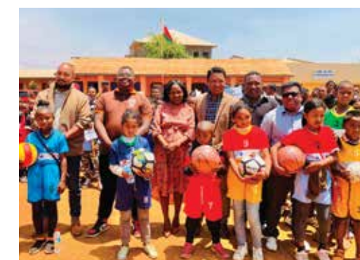
Distribution d'équipements sportifs dans des établissements publics.