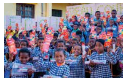
Distribution de kits scolaires

Pour l'année scolaire 2022-2023, 150 enfants ont été soutenus par l'association. Le Consulat a contribué au programme de l'association à travers l'achat des fournitures scolaires pour la réinsertion scolaire des enfants.