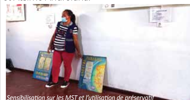
Sensibilisation sur les MST et l'utilisation de préservatif