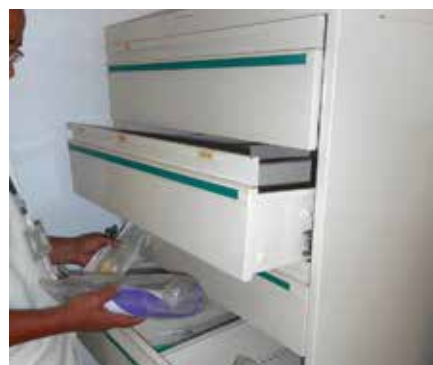
Armoire métallique et tubes désinfectants reçus par le CHU Ambohimandra

Le centre hospitalier a reçu : une armoire métallique, 09 lits picots pour enfant, 01 chaise sur roulette pour échographie, 04 cartons d'Anios nettoyant matériels médicaux, 05 tubes de désinfectants contact surface, 02 cartons de savon antiseptiques, 15 gels hydro alcooliques, 02 cartons de masques en tissu, 01 paquet de couche adulte, 04 cartons de perfuseurs à 3 voies, 04 cartons de seringues de gavage.