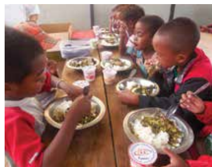
Pause déjeuner, un moment de partage avec les enfants.

Pour assurer une meilleure qualité des repas offerts aux enfants dans cette cantine, le Consulat appuie l'association en fournissant les desserts 3 fois par semaine pendant 5 mois au profit de 120 enfants bénéficiaires.