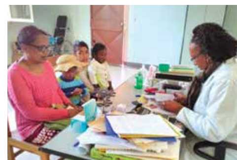
Consultation d'enfants avec un pédiatre.

Pour cette année, le Consulat a apporté son concours financier pour l'achat de certains médicaments afin d'assurer la pérennité des services médicaux.