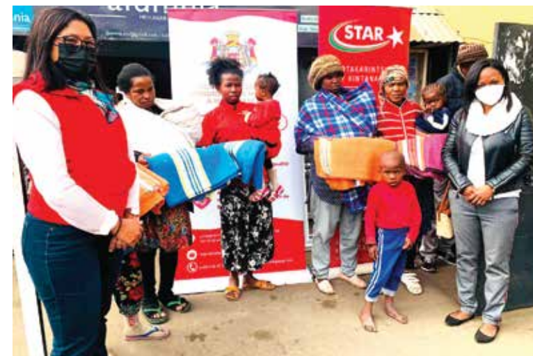
Distribution de couvertures dans un Fokontany avec la Brasserie STAR Madagascar.