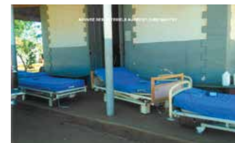
Des lits en plus pour les malades

Pour tous les services confondus, le centre a reçu : 04 lits avec matelas, 01 fauteuil repos malade, 1 berceau pliable, 01 chaise trouée, 01 déambulateur, 01 béquille, 02 cannes anglaises, 01 machine à écrire pour secrétariat, 02 cartons d'Anios nettoyage matériels médicaux, 03 cartons de gel hydro alcoolique, 02 cartons de solutions hydro alcooliques, 10 flacons d'Anios savon antiseptique, 06 cartons de poches à urine, 02 cartons de masques en tissu, 02 cartons de seringues 60 ml, 01 boîte de seringue 50cc, 02 boîtes de cathéter central.