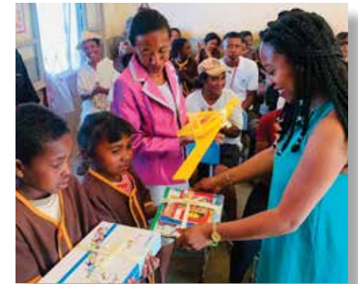
Distribution de livres et de matériels didactiques à l'Association Zohy Sera

La contribution du Consulat a permis d'acquérir 136 livres, 10 tablettes numériques, des matériels didactiques. L'Association Zohy Sera a également développé des outils ludiques qui aideront les enfants à mieux assimiler les éducations de base.