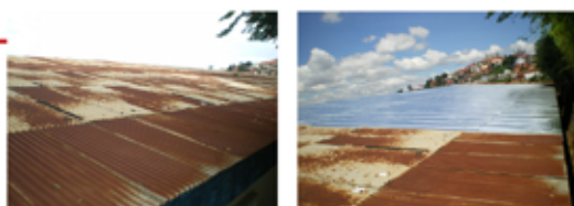
De gauche à droite : Avant travaux / Après travaux

La réfection de toute la toiture de l'école a ainsi été effectuée au début de l'année 2013. Il est à noter que l'école comptait 108 enfants durant l'année scolaire 2012-2013.