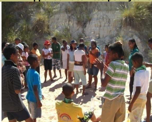
Jeux collectifs sur la plage de Majunga