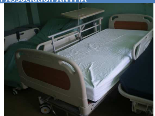
Lit remis par ANYMA au service oncologie du CHU JRA

■ ADS ■ NC ■ N°02/11 du 24/01/11, 19/11 du 19/05/11 et 63/11 du 25/11/11