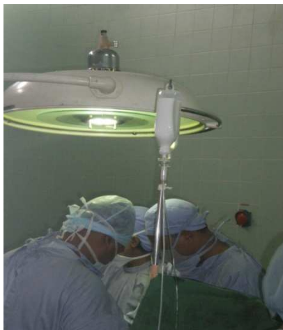
Scialytique en utilisation