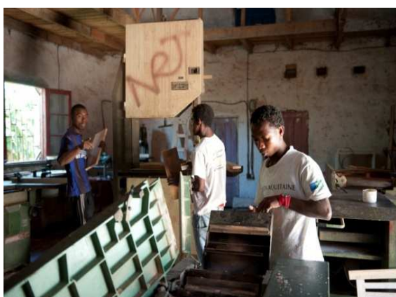
Apprentissage en menuiserie au centre Energie

Le projet touche plus de 900 jeunes par an âgés de 3 à 22 ans, et près de 60 professionnels de l'éducatif. Les actions des ONG partenaires visent à améliorer l'accueil et les actions éducatives, réintégrer les enfants accueillis dans le système scolaire, développer les formations professionnelles et les activités extrascolaires, améliorer la prise en charge sanitaire et nutritionnelle, et développer la coopération entre les associations. Entre autres, chaque année, les 4 ONG organisent en commun un spectacle, un théâtre et un tournoi de foot, qui contribuent à l'épanouissement de ces enfants. Des supports de sensibilisation à la protection de l'enfance et un support audiovisuel sont à la disposition de chaque partenaire.