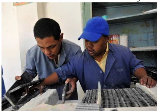
Atelier de fabrication de craies - Orchidées Blanches