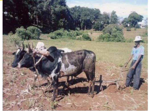
Un père de famille bénéficiaire avec les zébus

Le Consulat soutient depuis 2009 les actions sociales de l'association « ASA » (Ankohonana Sahirana Arenina ou Familles en grande précarité et réhabilitées) ayant comme vocation l'accueil et la réinsertion de familles sans-abri exclues ou en voie de marginalisation, afin de les aider et les accompagner à recouvrer dignité et autonomie. L'appui du Consulat s'est concentré dans l'amélioration de l'infrastructure du Domaine Saint François, structure d'accueil de l'association (construction des sanitaires, rénovation et extension du poulailler, du chalet de restauration et de la cour). Ce domaine participe activement à la réinsertion des familles en mettant à leur disposition une partie de ses terres cultivables.