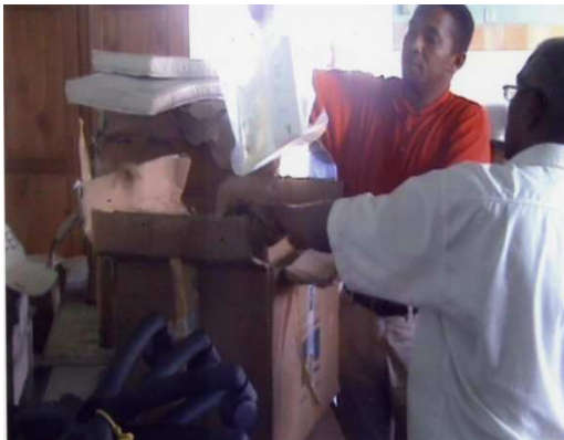
Déballage des matériels à l'arrivée à Mananjary

2 extracteurs d'oxygène, 3 matelas pour nouveau-nés, potences, divers consommables médicaux.