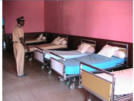
Lits et matelas pour le dispensaire d'Ampijoro

Créée dans le but d'améliorer les milieux environnementaux du Centre Hospitalier de Marovoay de la province de Mahajanga et les CSB environnants, l'association « Pour que vive Maroala » remet par la suite ces matériels au profit de ces structures sanitaires. Le matériel de mammographie a notamment été offert au CHU de Mahajanga.