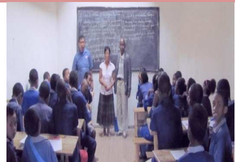
Une classe avec le Directeur de l'école, un professeur et la présidente de l'association (au centre)

L'effectif étant passé de 120 à 686 en 5 ans, et bien que de nouvelles salles de classes aient été construites, le collège est amené pour l'année scolaire 2011-2012 à louer d'autres salles de classes. Le nouvel appui du Consulat est ainsi principalement affecté à cette location.