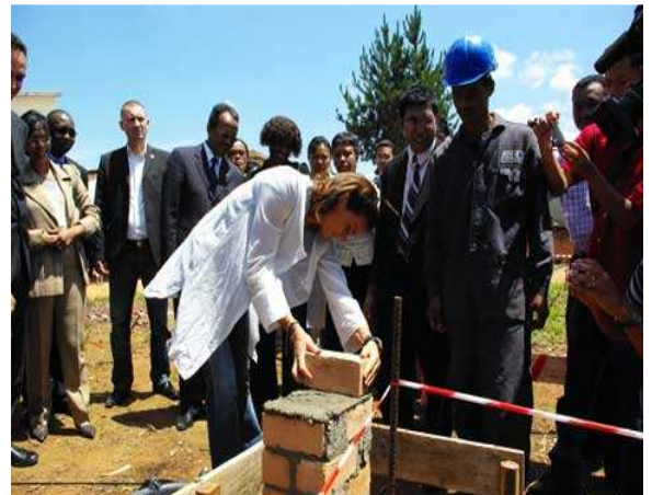
SAS La Princesse Stéphanie lors de la pose de la première pierre du Centre National de lutte contre le paludisme financé par la Principauté, en décembre 2008