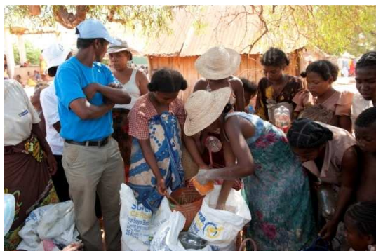
Programme de nutrition avec le PAM