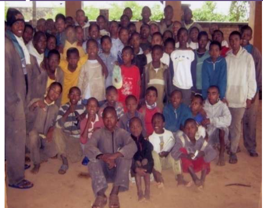
Les jeunes du centre d'Anjanamasina

Pour l'année 2011, la contribution du Consulat est allouée à l'appui et au renforcement des capacités des éducateurs spécialisés du Centre.