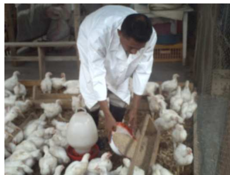
Investissement technique pour un membre à Tuléar