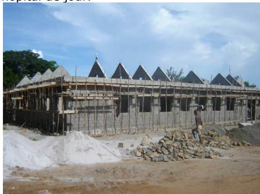
Centre de référence en construction à Manakara