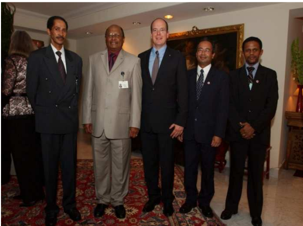
SAS Le Prince Albert II avec M. Marcel RANJEVA (2 e à gauche), Ministre des Affaires Etrangères et son staff, lors du Sommet des Nations Unies à New York en 2005