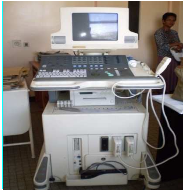
Dotation d'un échographe au CENHOSOA

Durant les 3 années du projet, 525 nouveaux cas devront bénéficier d'une consultation spécialisée, entre 55 et 77 enfants seront opérés à cœur fermé à Madagascar et 80 enfants opérés à cœur ouvert à La Réunion ou en Europe.