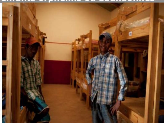
Dortoir de l'orphelinat