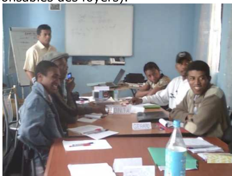
Formation en système micro-projet à Antananarivo