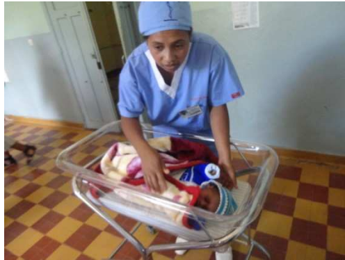
Lit pour nouveau-né

Concentrateurs d'oxygène, lits pour nouveau-né, table d'opération, divers consommables