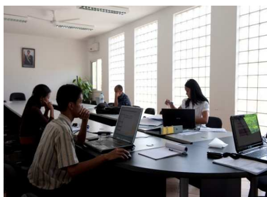
Les personnels du centre