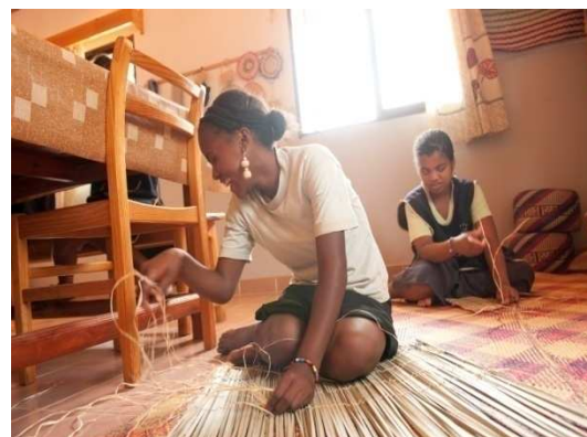
Initiation à la vannerie pour jeunes filles malvoyantes du Centre EPHATA