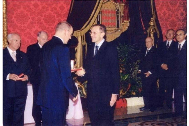
Ci-contre : SAS Le Prince Souverain Albert II avec le Consul, M. Cyril JUGE, lors de la visite officielle du Prince à Madagascar en mars 2003