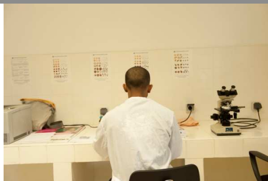
Un chercheur au laboratoire

Opérationnel depuis 2010, le centre abrite désormais la Direction en charge de la lutte contre le paludisme au sein du Ministère de la santé et met en œuvre le programme d'activités initialement prévu (formation, sensibilisation, laboratoire, stratégie etc) avec la présence active d'une Volontaire Internationale de Monaco au poste de biologiste depuis avril 2010.