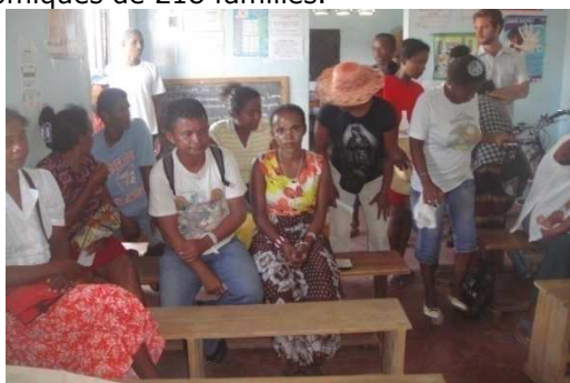
Formation pour renforcement de gestion

L'appui de la Coopération monégasque aura permis, au terme du projet fin 2011, notamment d'octroyer un prêt à 1.200 micro-entrepreneurs et 2.200 prêts productifs, de former et suivre le projet de 1.900 adultes défavorisés et micro-entrepreneurs, et de résoudre les problèmes socio-économiques de 218 familles.