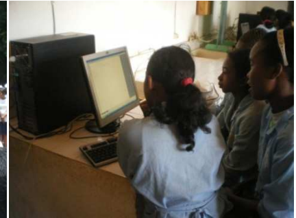
CEG Sabotsy Namehana