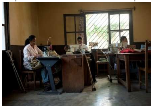
Atelier de confection - UNHAM