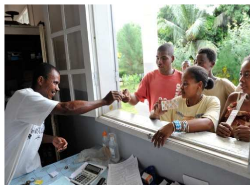
Distribution de médicaments au CSB