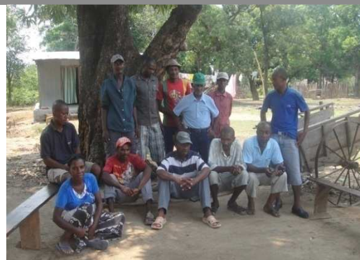
Quelques membres de l'une des associations de producteurs de noix de cajou de l'Aire Protégée d'Andrafiamena

Circonscrite dans les districts d'Antsiranana II et d'Ambilobe, l'Aire Protégée d'Andrafiamena Andavakoera présente un intérêt tant floristique que faunistique et paysager, lui permettant de compter parmi les plus grandes aires protégées du Nord de Madagascar. Les activités prévues comprennent ainsi, outre celles visant le renforcement des acquis du projet initial, le développement d'un tourisme durable communautaire au sein de l'Aire protégée, et le développement de filières porteuses contribuant au financement durable des activités de gestion de l'Aire protégée. Parmi les réalisations de la première année d'exécution du nouveau programme, on peut citer la structuration de 9 associations de producteurs de riz parfumé et de noix de cajou, la mise en place d'un 5 ème circuit touristique sur l'Aire protégée, la formation de 7 guides locaux, le démarrage des travaux de construction de l'infrastructure d'hébergement et de restauration.