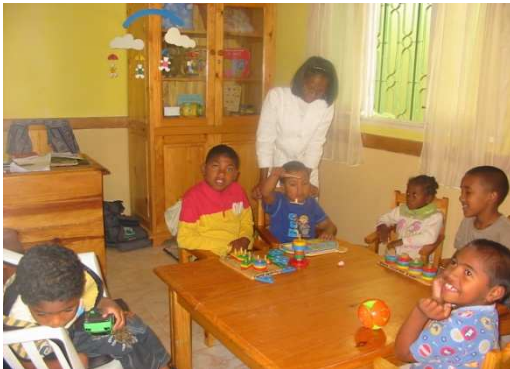
Section des petits

Le Centre a été créé en 2003 par des personnes handicapées physiques, et œuvre pour l'insertion scolaire et professionnelle d'enfants et jeunes handicapés physiques. L'objectif principal est d'aider ces personnes à se prendre en charge, par la voie de l'éducation et de la formation.