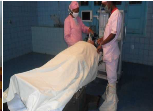
Table d'opération en utilisation