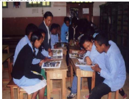
Elèves du Lycée Mantasoa