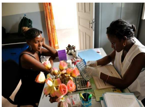
Suivi médical d'une patiente