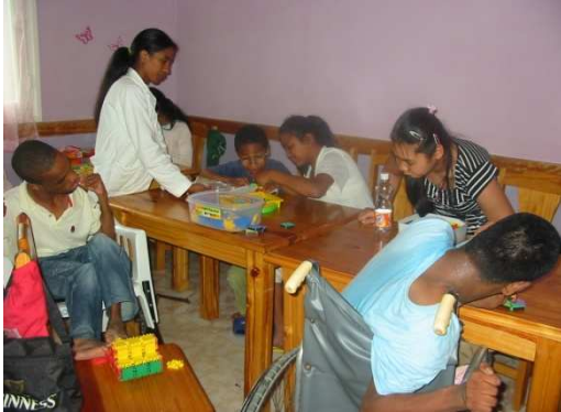
Section des grands