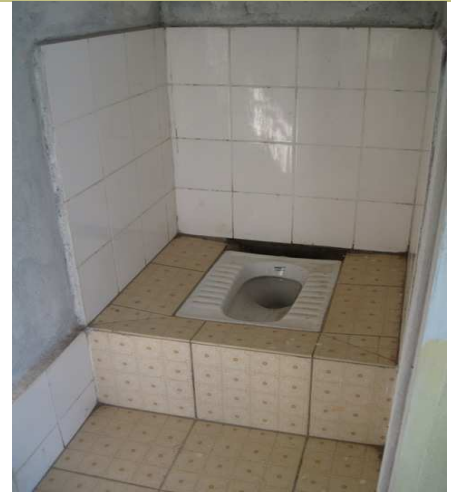
Une partie des sanitaires rénovés

Une nouvelle subvention a été accordée en 2011 afin de poursuivre la rénovation des sanitaires du Centre d'accueil de Mahambo.