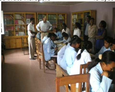
Centre de documentation du CEG SabNam