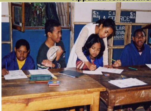
Quelques élèves du centre