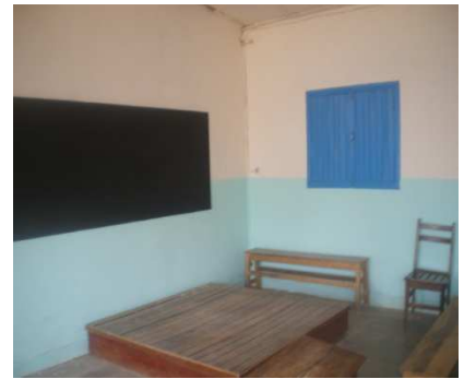
Salle de classe repeinte et nouveau tableau noir

■ Ar 3.000.000 ■ N° 09/11 du 18 mars 2011