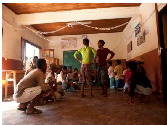
Préparatifs de spectacle chez « ENDA OI »