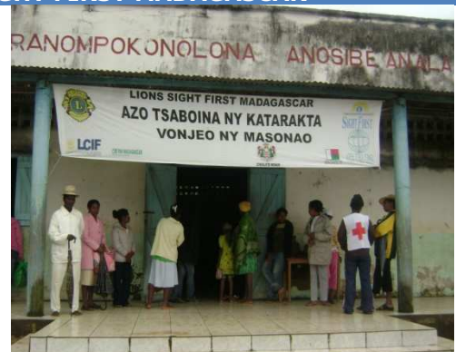
Dépistage de cataracte à Anosibe An'ala