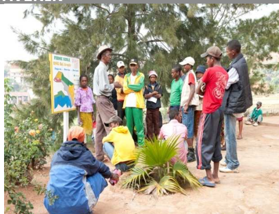
Des jeunes bénéficiaires à la ferme-école

Les programmes de ces séjours sont composés de visites pédagogiques, activités ludiques, exercices au développement de l'esprit communautaire et civique, animations de promotion de la lecture et publication de contes pour enfant véhiculant la culture malgache.