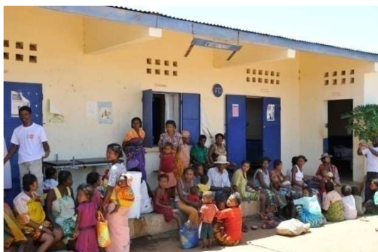
Fidélisation de l'utilisation des services SR par l'UNFPA

Au terme du projet, le programme touchera 14.700 femmes, soit 80% des femmes en âge de procréer et 4.200 enfants de 0 à 2 ans par an. A l'issue de 3 années d'intervention, il a pu être constaté que les femmes enceintes et allaitantes fréquentent mieux les centres de santé et utilisent des SR ; certaines CSB II des communes cibles ont doublé voire triplé le nombre d'accouchements. En avril 2011, dans le cadre de ce programme, un VIM a pris ses fonctions auprès du PAM à Antananarivo, en qualité d'Assistant de Programme Santé/Nutrition.