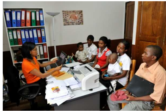
consultation et approche auprès des enfants malades