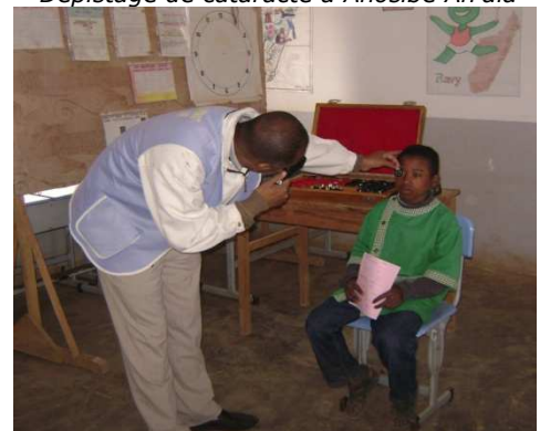
Consultation d'un élève par un réfractionniste LSFM