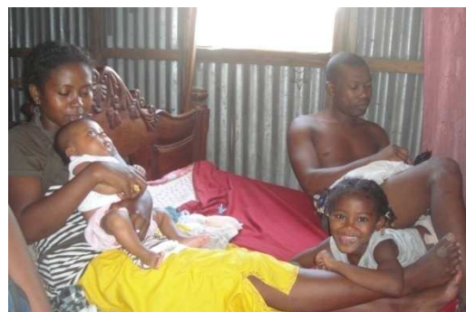
Une famille bénéficiaire