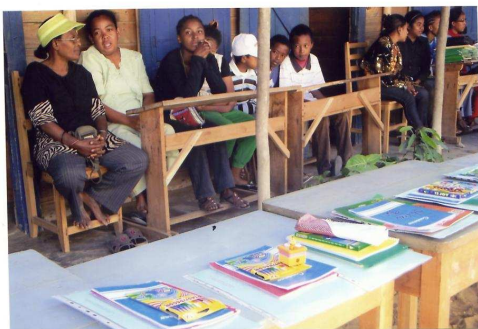
Ecole La Fontaine à Morondava