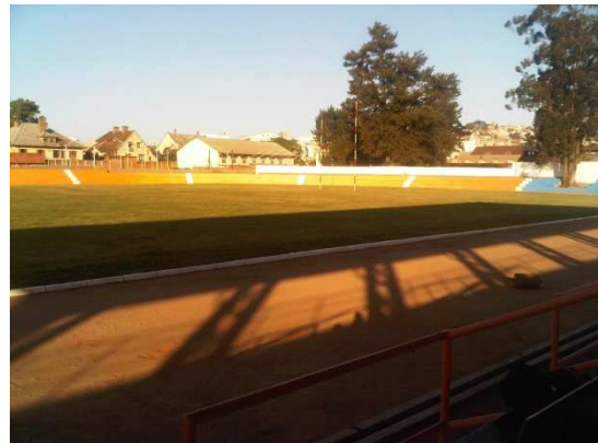
Le stade réhabilité